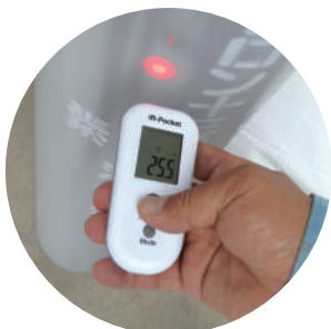
▲赤外線表面温度計